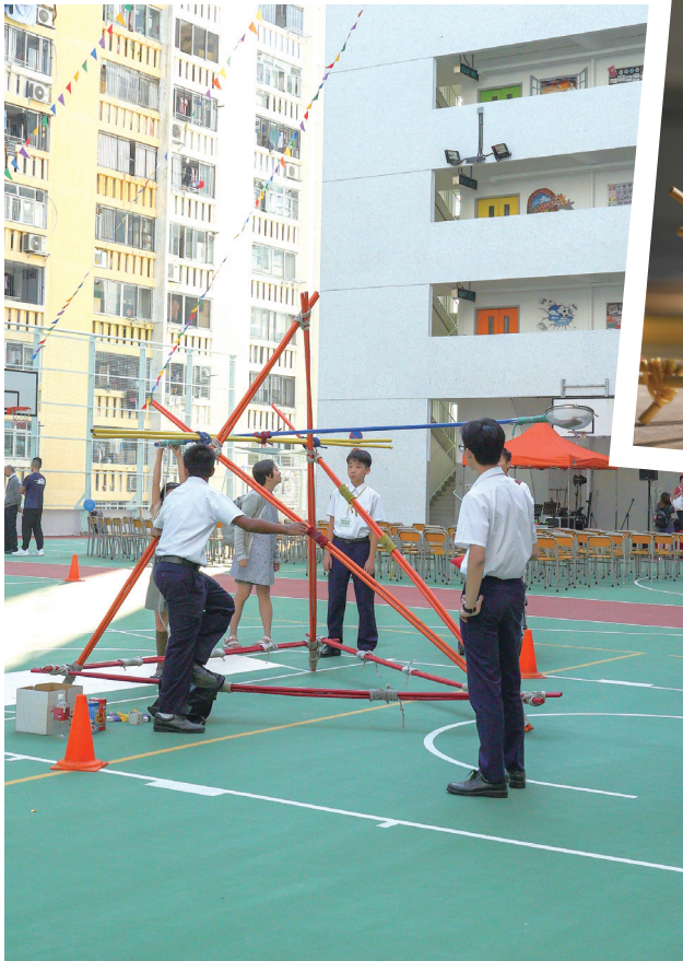
校長十分鼓勵學生發揮創意，活用 STEM 的學習所得。