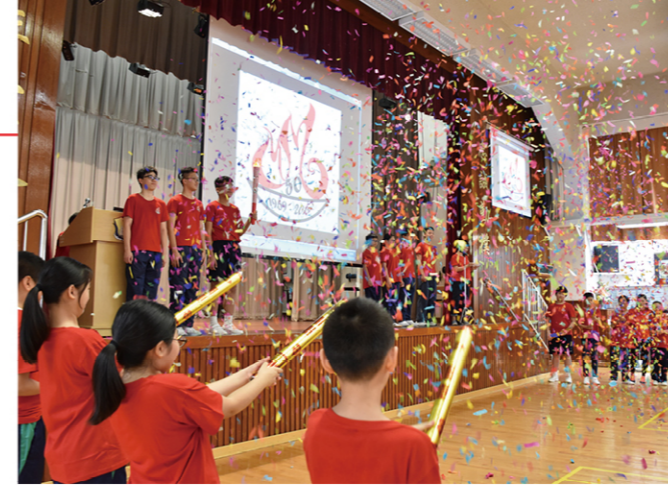
師生一同放彩炮，賀校慶金禧之喜。