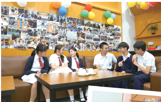
同學可結伴到咖啡休閒角，休息、閒聊、溫習各適其式，也締造學生對校園的歸屬感。

彭耀鈞校長希望為學生創建舒適學習環境，令學生對學校產生歸屬感，主動投入學習。他強調學習就是生活，着力協助學生建立積極和正面的價值觀，為他們從事尚未出現的職業，以及融入全球化的世代而努力。