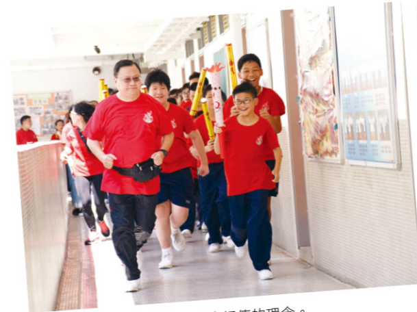
透過火炬接力傳遞，帶出新火相傳的理念。