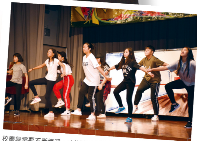
校慶舞需要不斷練習，才能達致合拍齊整，過程中亦加強了同學們合作和溝通的能力。